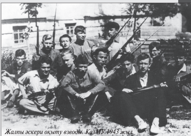
Жалпы әскери оқыту взводы. ҚазМУ 1943 жылы